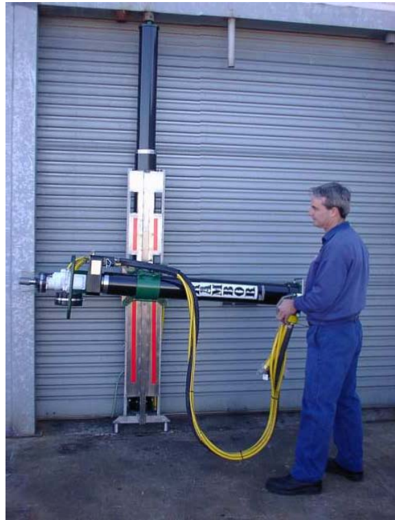
图片显示的为 带行程为1.3 or 1.7 米的两级/双动长壁工作面钻孔机的RDR2